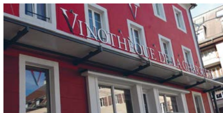
Magasin de La Chaux-de-Fonds Place du Marché +41 32 968 71 51