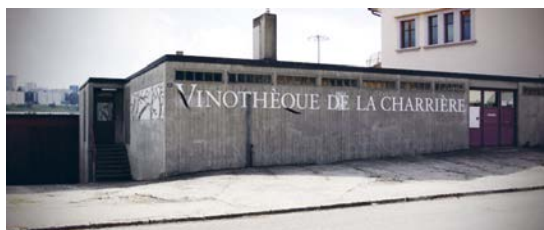
Bureau et entrepôts de La Chaux-de-Fonds Rue de La Charrière 84 +41 32 968 07 79 info@vinotheque-charriere.ch