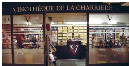
Magasin de Neuchâtel Rue de l'Hôpital 12 +41 32 724 71 51